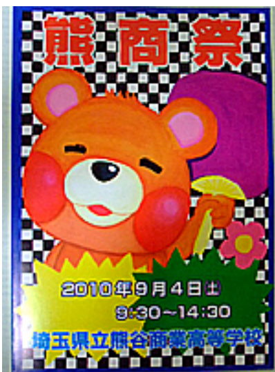
パンフレット 3-6 荻野美幸さんのデザイン