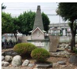
熊商シンボル「希望の塔」

期 日：平成22年11月6日(土) 場 所：熊谷会館(熊谷市末広3-9-2) 熊谷駅(北口)下車 徒歩15分 受 付：12時30分～ 開会 13時00分