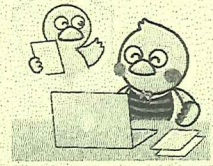
埼玉県のマスコット 「コバトン」「さいたまっち」