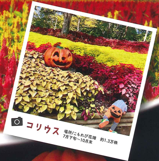
📷 コリウス 場所にもれび花畑 約1.3万株 7月下旬~10月末

10/18(金)~27(日)の 金土日 17:00~20:30 (最終入場は20:00まで) 会場 中央口エリア (中央口~カエデ園~植物園) 雨天中止(当日14:00決定)